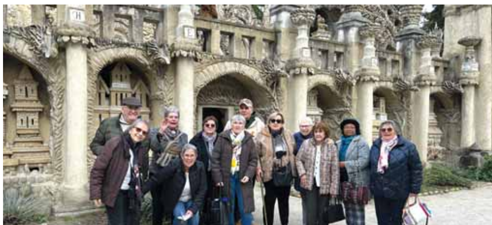
Journée à Hauterives et visite du palais du facteur Cheval