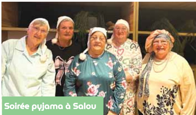
Soirée pyjama à Salou

A travers cette nouvelle étape, c'est un message de stabilité, d'engagement et de confiance qui est adressé à l'ensemble des séniors peyniérens : les activités se poursuivent, l'esprit du club demeure, et la volonté collective de faire vivre ce précieux espace de rencontre reste plus forte que jamais.